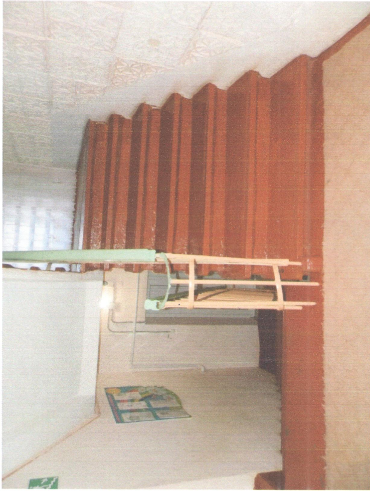
Лестничный марш на 1-й этаж