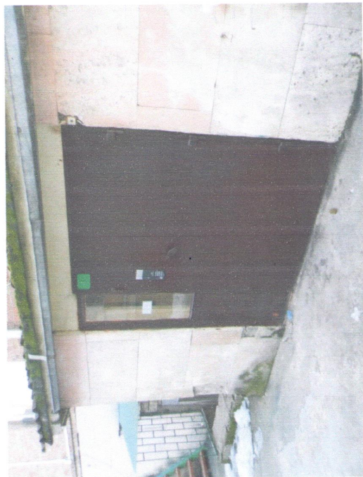
Вход в здание