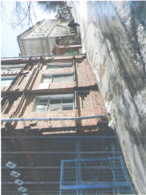
Приложение 1 Территория прилегающая к зданию