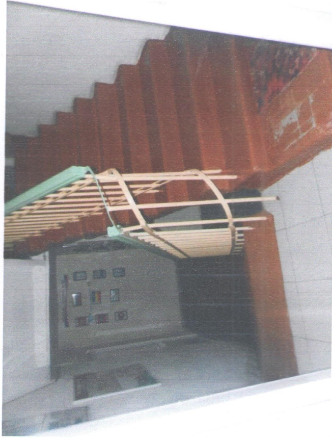
Лестница внутри здания