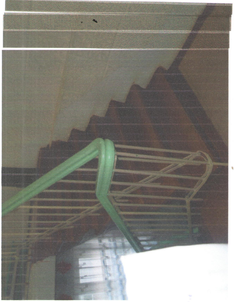
Лестничный марш на 2-й этаж