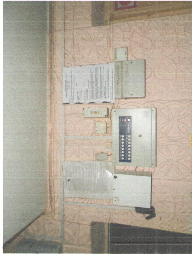
Пульт пожарной сигнализации